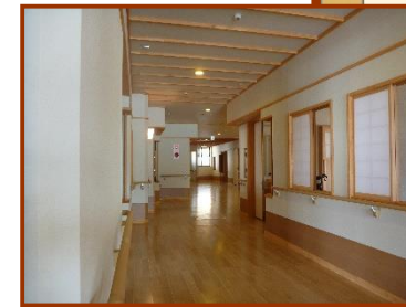
■ 廊下 (増築部)