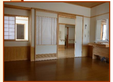
■ 居室 (増築部)